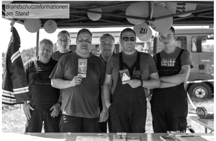
Brandschutzinformationen am Stand