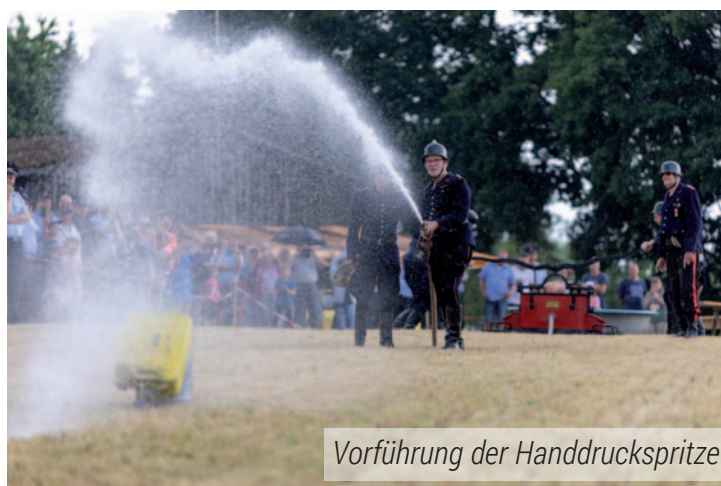
Vorführung der Handdruckspritze