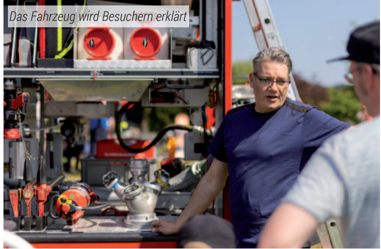
Das Fahrzeug wird Besuchern erklärt