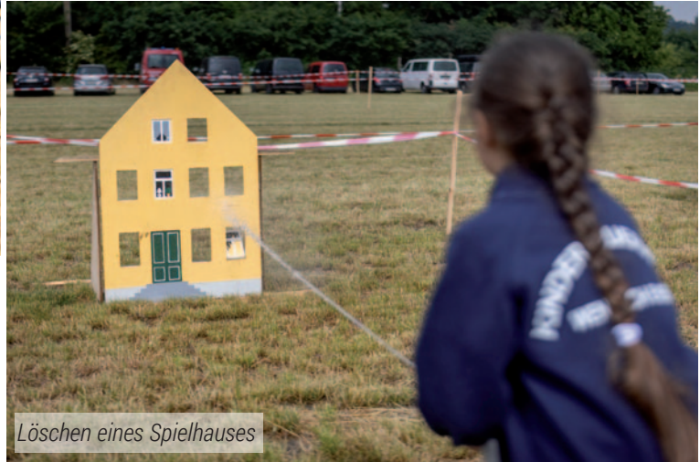
Löschen eines Spielhauses