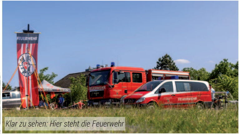
Klar zu sehen: Hier steht die Feuerwehr