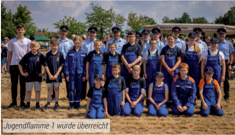
Jugendflamme 1 wurde überreicht