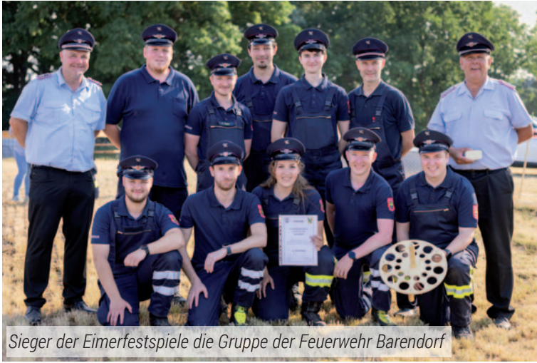
Sieger der Eimerfestspiele die Gruppe der Feuerwehr Barendorf