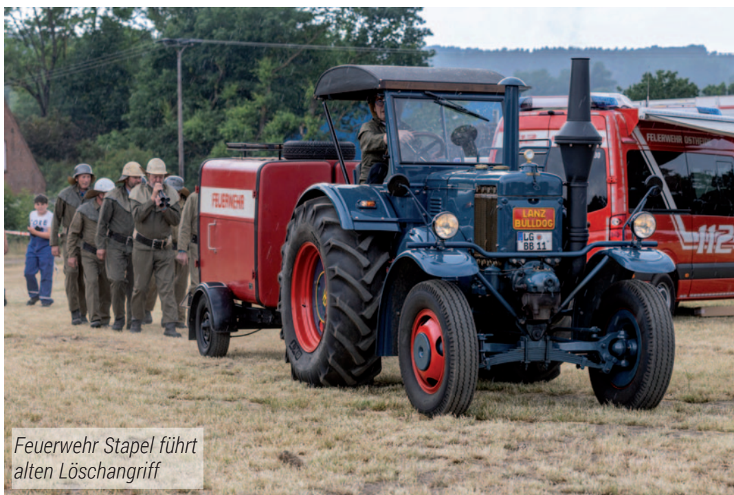
Feuerwehr Stapel führt alten Löschangriff